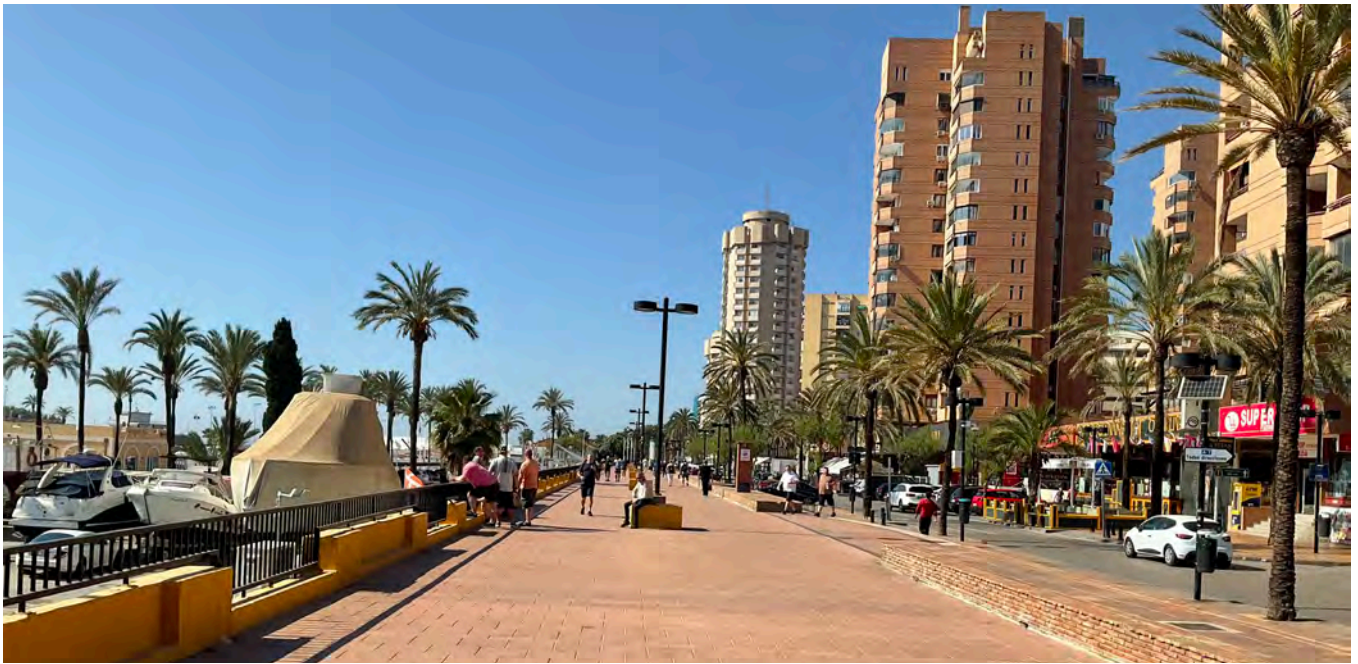
Kävelykatua Fuengirolassa riittää.