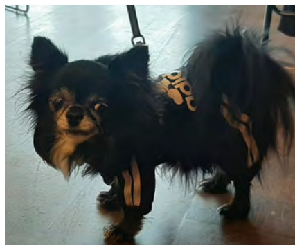
Chihuahua Romeo nukkui kokouksen ajan pienissä vaunuissaan ja kuorsasi niin, että sali raikui.

Kokouksen kohokohta oli kuitenkin tulevan sukukokouksen suunnittelu, joka pidetään