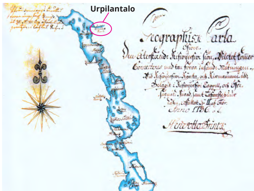
Kivijärven kartta vuodelta 1736.

Kun kysyttiin syytä, sano hän voan: ” Jopa tuolta on kaikki karhutkin loppunna metistä, ett'eivät enää kelvollista lihapaistia soa”.